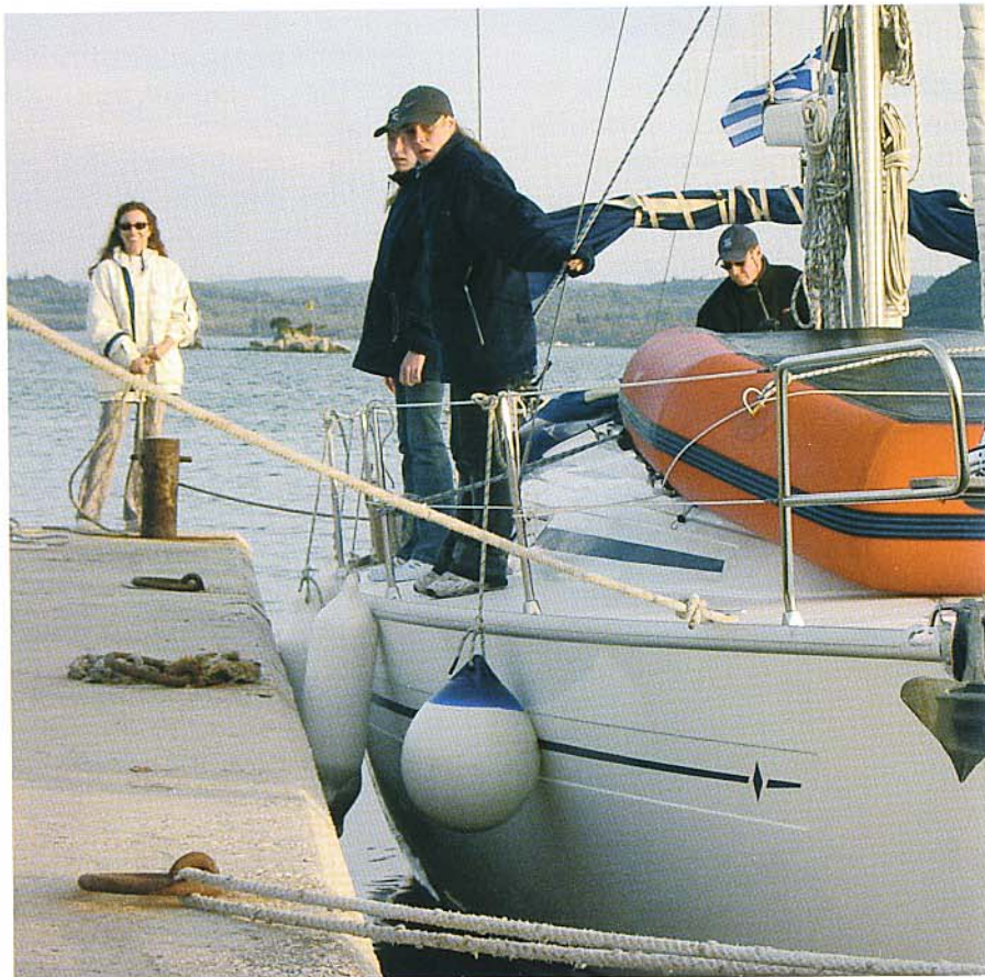
Die Leinen werden an Pollern und Ringen belegt.